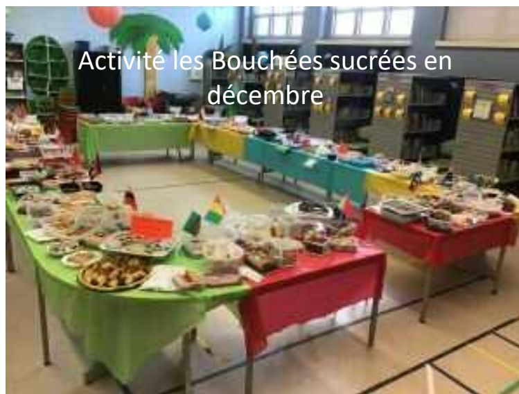
Activité les Bouchées sucrées en décembre